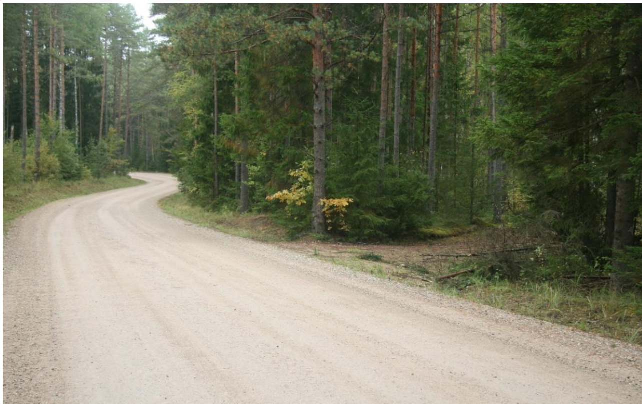
Foto 2. Kiisaniidu tee ristumine riigiteega.