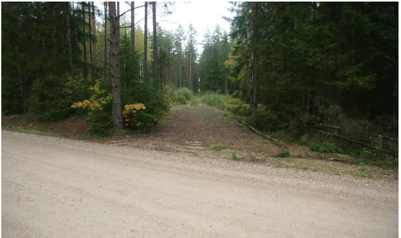
Foto 1. Kiisaniidu tee algus. 23.09.2022.a.

Liikluskorraldusvahendeid esineb piirkonnas minimaalselt. Piiratud nähtavuse tõttu ning liiklusohutuse suurendamiseks tuleks metsa väljaveo ajaks riigiteele mõlemale poole Kiisaniidu tee mahasõitu paigaldada kiirust piiravad ajutised liiklusmärgid.