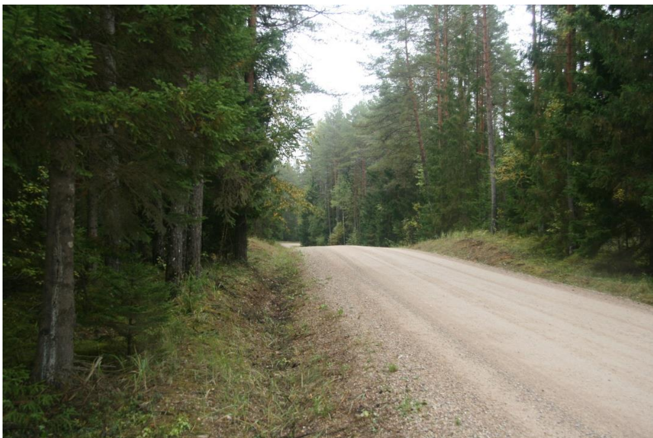
Foto 3. Kiisaniidu tee ristumine riigiteega, vaade vasakule.