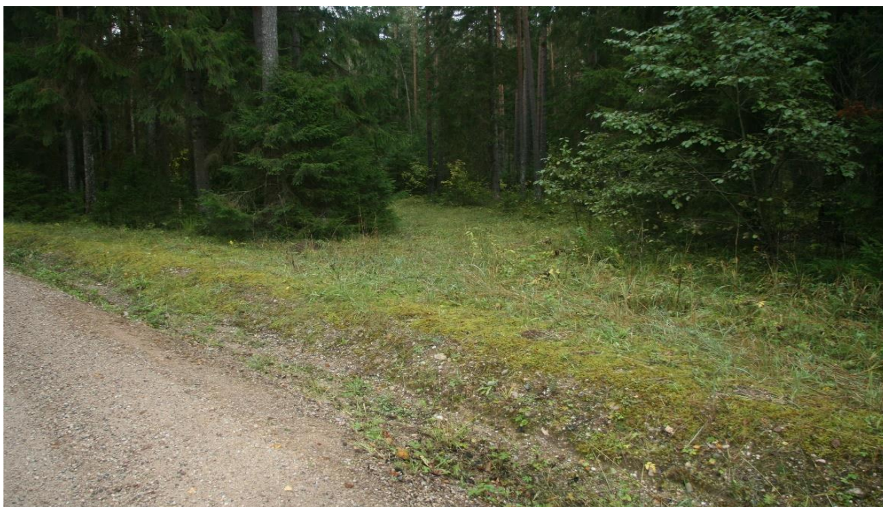
Foto 5. Tapusaarõ tee lõikumine riigiteega.

Projektiga rajatav Tapusaarõ tee kulgeb metsasihil (foto 5).