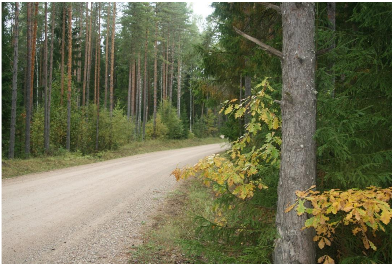
Foto 4. Kiisaniidu tee ristumine riigiteega, vaade paremale.

Projektiga rajatav Tapusaarõ tee kulgeb metsasihil (foto 5).